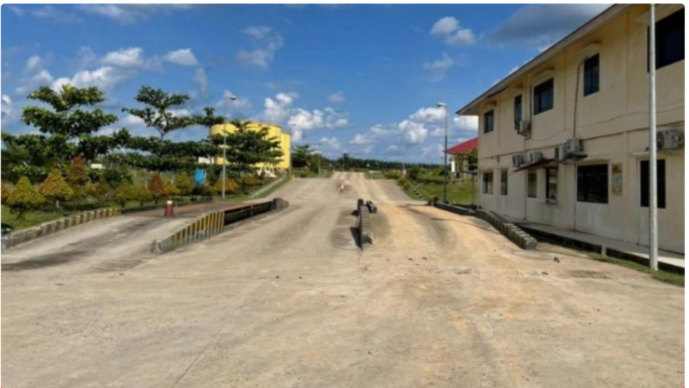
Pabrik PT Berkala Maju Bersama (PT BMB) Kecamatan Manuhing Kabupaten Gunung Mas

PALANGKA RAYA - Kisruhnya keadaan perusahaan yang bergerak di bidang perkebunan kelapa sawit di Kecamatan Manuhing Kabupaten Gunung Mas (Gumas), Kalimantan Tengah (Kalteng) yaitu PBS PT Berkala Maju Bersama (PT BMB).