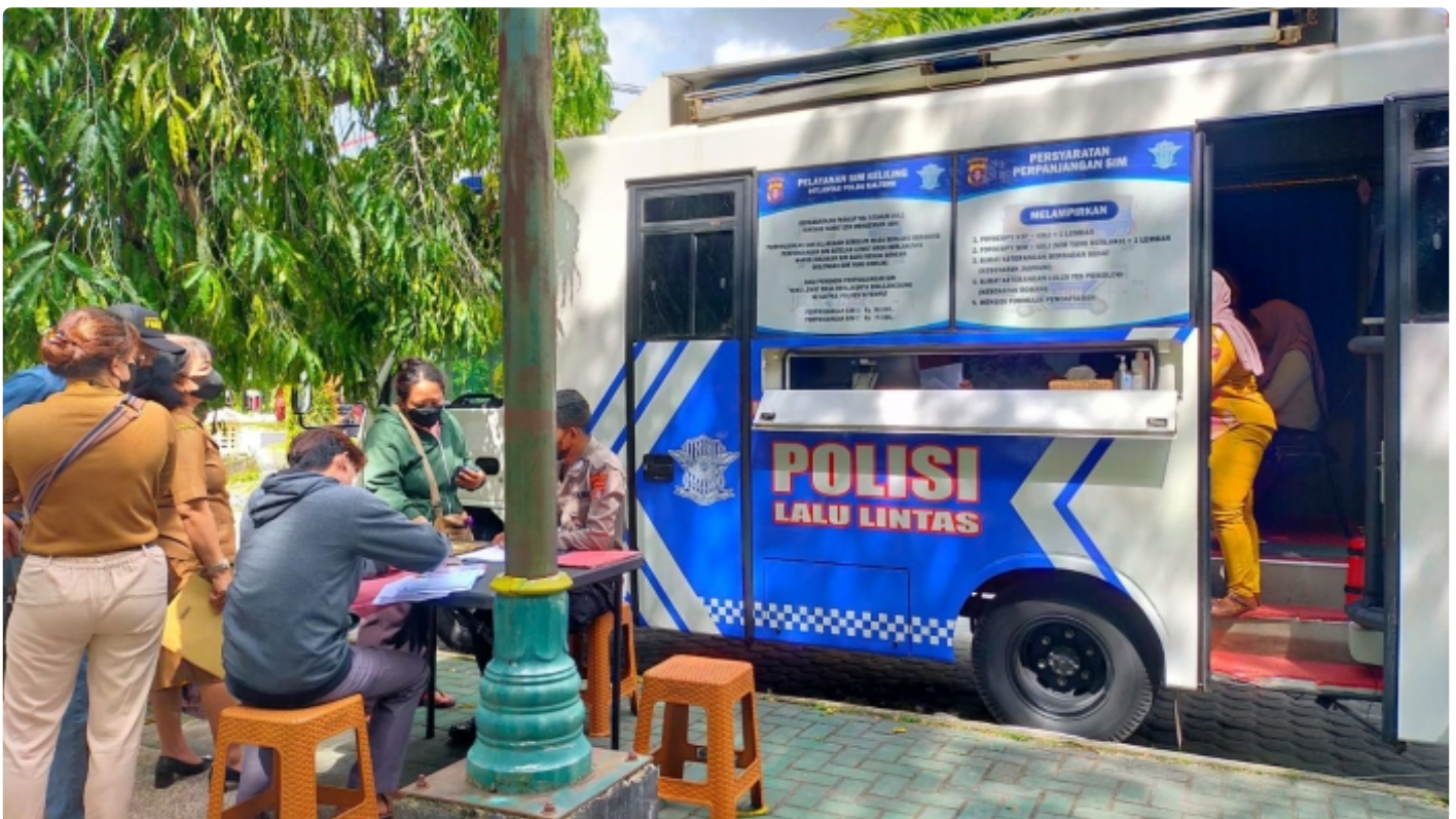
Bus Keliling Dirlantas Polda Kalteng

PALANGKA RAYA - Direktorat Lalu Lintas (Dirlantas) Polda Kalteng berikan pelayanan Surat Ijin Mengemudi (SIM) keliling bagi masyarakat Kota Palangka Raya. Selasa (6/12/2022) Pagi.